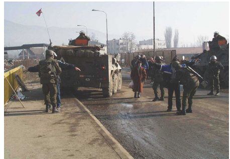
Personen- und Fahrzeugkontrolle

Hinter vielen negativen Überlegungen stehen Ungewissheit, Sorgen und Ängste. Diese sollten akzeptiert und hinterfragt werden. Solche Fragen könnten z.B. lauten: