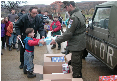
Weihnachtspakete für Familien im Kosovo

Positive Begleiterscheinungen eines Auslandseinsatzes sind: