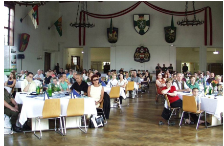
Angehörigeninformation im Rahmen eines Familientages

Mit diesen Familieninformationstagen wollen wir den Angehörigen Einblicke in den „Soldatenalltag“ vermitteln und über das Einsatzgebiet hinsichtlich der militärischen, politischen und wirtschaftlichen Lage informieren. Dabei wird ein aktueller Überblick