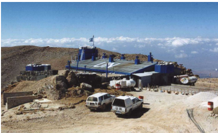
Position Hermon Süd/ Syrien

Nützen Sie jede Gelegenheit für gemeinsame, schöne Erlebnisse. Verbringen Sie einen netten Abend mit dem Partner oder genießen Sie einen erholsamen Ausflug mit der ganzen Familie. Die Erinnerung daran wird Ihnen