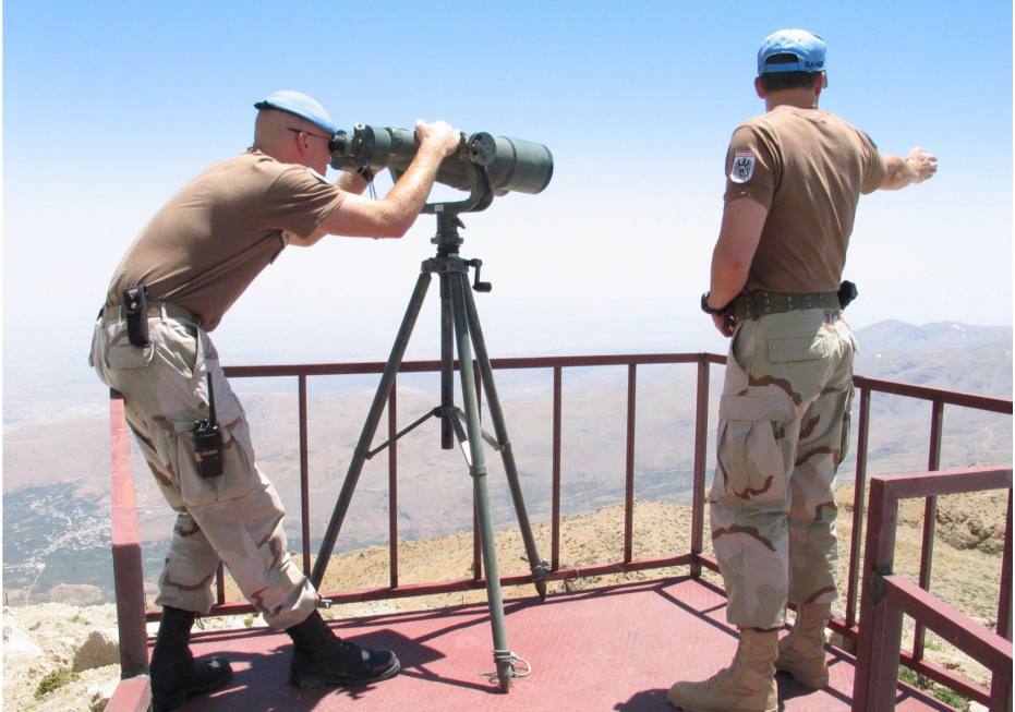
Weite Sicht ins Land vom Mt. Hermon/Syrien