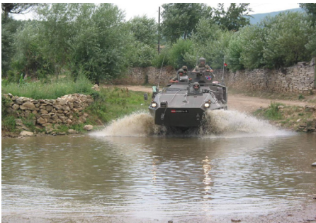
Queren einer Furt mit dem Pandur

mäßige und ausgewogene Ernährung. Pflegen Sie gute Kameradschaft und gestalten Sie Ihre Freizeit möglichst aktiv. Vermeiden Sie übermäßigen Alkoholgenuß und den Konsum von Drogen. Dazu gehören auch illegale Muskelaufbaupräparate und andere verbotene Substanzen. Auch ein übermäßiger Konsum von elektronischen Medien (Internet, Videos, Pornographie etc.) beinhaltet ein nicht zu unterschätzendes Suchtpotential und die Gefahr einer zunehmenden Isolation sowohl im Einsatzraum als auch nach der Heimkehr.