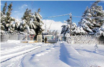
Einfahrt zu Camp Faouar/ Syrien

Diese Ängste können für alle Beteiligten sehr belastend sein.