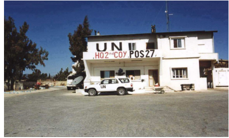
Position 27 / Syrien

Knüpfen Sie Kontakte zu gleichgesinnten Soldaten und deren Familien, um für den Fall von Krisen ein soziales Netz aus Hilfsangeboten und Informationsquellen bereitzuhaben. Neben zivilen Vereinen und sozialen Einrichtungen bieten die Familientage ein gutes Forum neben den aktuellen Informationen die gegenseitige