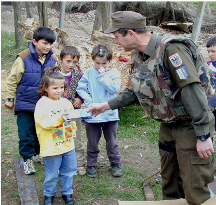
Zivil-militärische Zusammenarbeit (CIMIC) Verteilung von Hilfsgütern

Sprechen Sie auch mit Ihren Kindern regelmäßig und offen über die Trennungssituation. Betonen Sie immer wieder, dass Ihr Partner trotz seiner derzeitigen Abwesenheit ein unverzichtbares und wichtiges Mitglied der Familie ist.