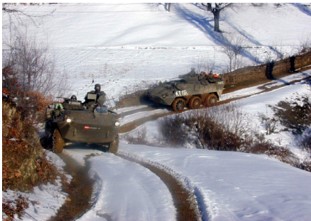
Patrouille im Kosovo

Auch der Zeitpunkt des Abschiednehmens und der Abreise kann sehr belastend sein. Treten jetzt vermehrt Gefühle von Gereiztheit, reduzierte Vertrautheit oder fehlende Intimität bei Ihrem Partner auf, so interpretie-