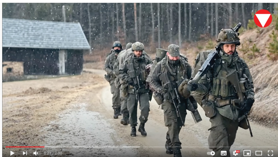
Der Weg zum Miliz-Unteroffizier

Für aktuelle Informationen und Lernunterlagen buchen Sie den Lehrgang „Informationsmodul Miliz“ unter stammportal.bmlv.gv.at . Ihre Zugangsdaten finden Sie als Beilage zu Ihrem Einberufungsbefehl oder erhalten Sie telefonisch unter 050201 99-1660.