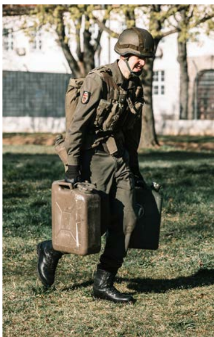
Zweimal 18kg "hängen sich an"!

Für die Erstellung der Dienstvorschriften des Bundesheeres zum Thema „Körperausbildung“ und des Konzepts „Körperliche Leistungsfähigkeit“ wurden die bisherigen Regelungen einer Evaluierung unterzogen. Das Ergebnis der Evaluierung: Es sind komplexere Testverfahren notwendig, um die körperliche Leistungsfähigkeit zu bestimmen.