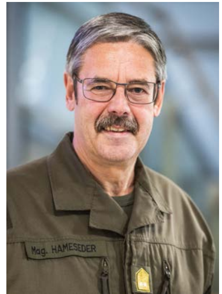
Generalmajor Erwin Hameseder

Die „Miliz-Zertifizierung“ letzten Jahres war ein Meilenstein: Die TÜV-AUSTRIA schaffte in Zusammenarbeit mit dem Verteidigungsministerium eine nach zivilen Normen darstellbare Zertifizierung der militärischen Fähigkeiten. Damit ist uns gelungen, die beim Bundesheer erworbenen Qualifikationen in sieben Qualifizierungsstufen transparent und verständlich darzustellen. Aktuell arbeiten wir an der Einführung eines „Bildungsschecks Miliz“ nach dem Muster der Schweiz. Der Zweck ist das Herstellen einer Symbiose des Bundesheeres mit der Wirtschaft, um das Milizsystem zu fördern. Der „Bildungsscheck Miliz“ steht für die qualifizierte Weiterbildung für den Arbeitnehmer am Arbeitsplatz zur Verfügung, er kann nach Maßgabe des Arbeitgebers eingelöst werden. Die Planungen zur Umsetzung des „Bildungsschecks Miliz“ durch das Bundesministerium für Landesverteidigung befinden sich noch im Anfangsstadium.