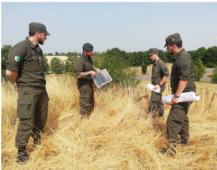
Ausbildung Führungsverfahren. Wer auf diesem Bild ist Milizsoldat? Antwort: Alle vier!

Das Bundesheer ist zur Erfüllung seiner Friedens- und Einsatzaufgaben auf die Miliz angewiesen. Nur durch die Miliz können die geforderte Einsatzstärke und die Durchhaltefähigkeit erreicht werden. Die letzten Jahre haben gezeigt, dass ein hoher Bedarf an Miliz-Nachwuchs aller Dienstgrade und Waffengattungen besteht. Daraus resultierend wurde neben der Kaderanwärter-