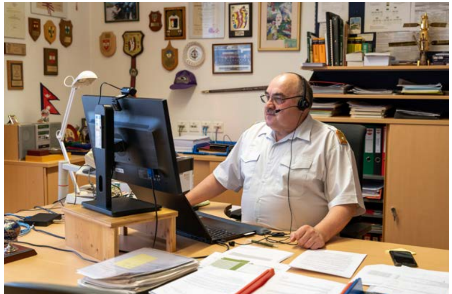
Brigadier Thaller arbeitet für ein Ziel: Den Einsatz

Zusammenfassend kann man von einem Erfolg der Aufbietung und der Auftragserfüllung durch die eingesetzten Milizkräfte sprechen.