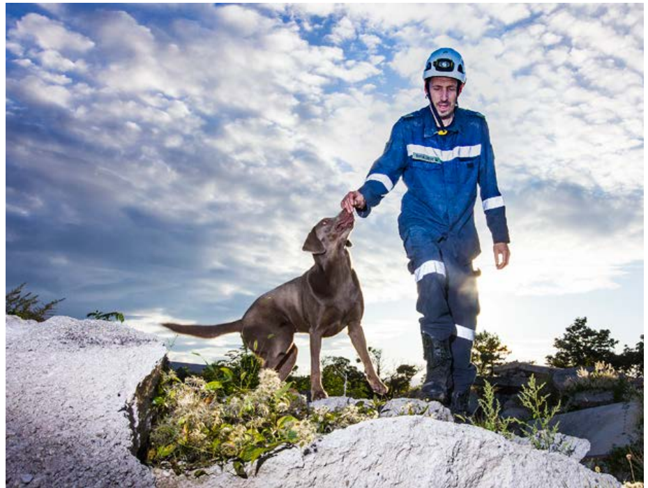
Rettungshunde, für die Menschenrettung unerlässlich!

Nach dem Ende des zweiten Weltkrieges wurde mit der Gründung der Vereinten Nationen (UN) der Grundstein für die internationale humanitäre und Katastrophenhilfe gelegt. Diese Initiative entsprang dem wachsenden Selbstverständnis, Katastrophen und deren humanitären Auswirkungen gemeinsam zu bewältigen. Auch Österreich beteiligte sich daran – anfangs noch mit regulären Soldaten. Der erste Einsatz im Dienst der Vereinten Nationen war 1960. Damals entsandte Österreich ein Sanitätskontingent in den Kongo. Die Wende kam nach dem Erdbeben im Armenien im Jahre 1988. Aufgrund der Erfahrungen, die das Bundesheer mit seinen Rette- und Bergeskräften in humanitären Einsätzen machte, war klar: Diese Aufgaben passen nicht in das Leistungsspektrum irgendeiner Einheit des Bundesheeres. Dazu braucht es Menschen mit speziellen Kenntnissen, spezielle Ausrüstung und spezielle Abläufe. 1990 wurde die Austrian Forces Disaster Relief Unit gegründet.