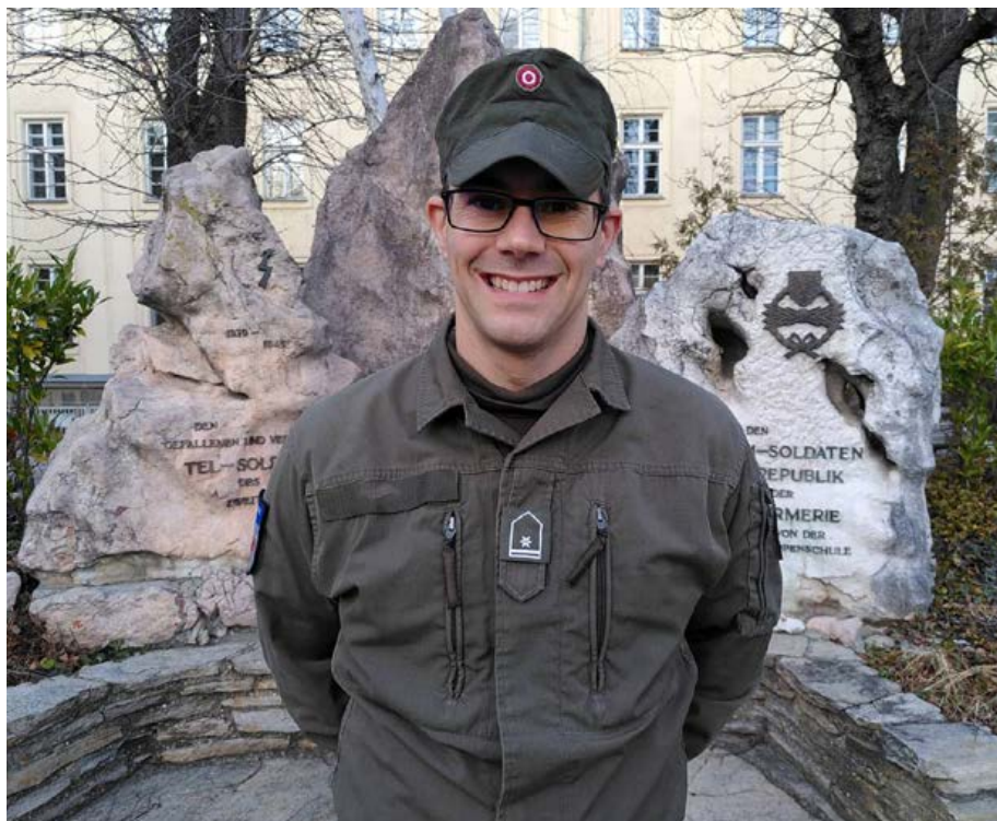
Dominik E. ist ein „Spätberufener“. Für die Miliz war das kein Hindernis.

Er unterschrieb die Freiwilligenmeldung und wurde in die 2. Kompanie des Jägerbataillons Tirol beordert. Das Abenteuer bekam er gleich – 2020 ging er mit der Kompanie für drei Mo-