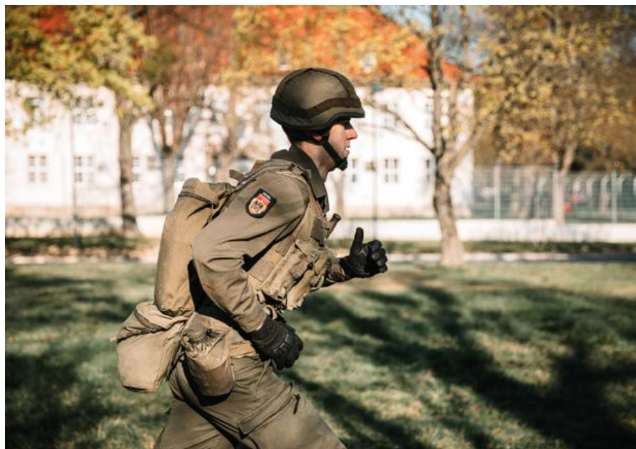
Laufen ist immer noch die schnellste Bewegungsart!

Das Gesamtgewicht der Ausrüstung für die Durchführung des Soldaten-Parcours beträgt 21 Kilogramm [+/- 1 Kilogramm].