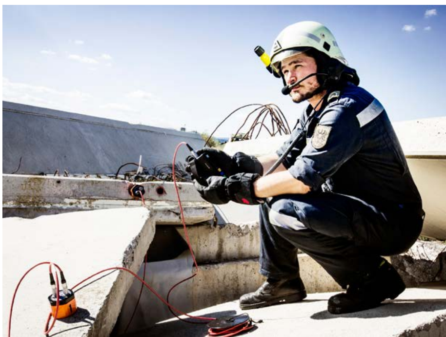
Mit dem Schallortungsgerät lassen sich Richtung und Tiefe von Geräuschen bestimmen.

Als besondere Fähigkeit kann AFDRU im Einsatzraum sowohl ein Reception- and Departure Center (RDC) als auch eine Urban Search- and Rescue Coordination Cell (UCC) stellen. Beide Einrichtungen sind wesentliche Bestandteile zur Koordination im