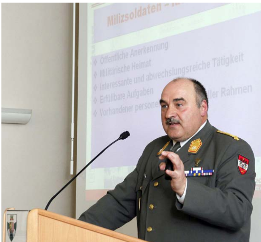
Wesentlich, auch Arbeitgeber „mit an Bord“ zu holen.

Hierzu ein paar Zahlen mit Stand Anfang Februar 2022, die zeigen, wie hoch der Anteil der Miliz mittlerweile geworden ist: Von 2 744 Soldaten im In- und Auslandseinsatz waren 1.178 Milizsoldaten (901 Inland und 277 Ausland) – das entspricht einem Anteil von ca. 43%!