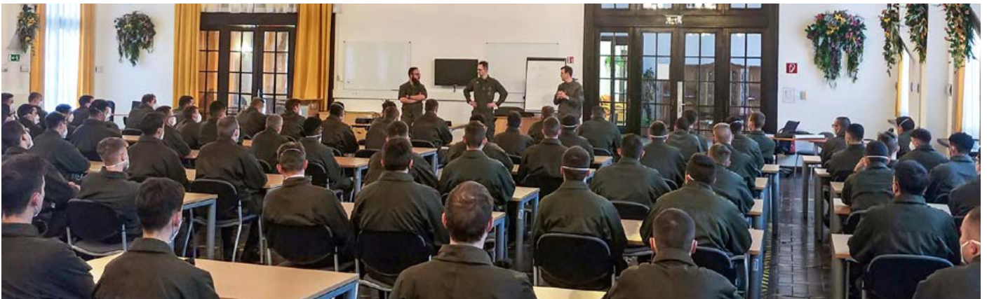
Miliz wirbt Miliz vor vollem Haus bei der Garde in der Maria Theresien-Kaserne

Milizwerbung wurde in der Vergangenheit unterschiedlich gehandhabt. Manche Verbände waren erfolgreich, andere behandelten dieses Thema stiefmütterlich. Eines war dem Großteil gemeinsam: In der Werbung um den Nachwuchs waren kaum bis keine Milizsoldaten involviert. Das hat sich nun geändert. Das Projekt „Miliz wirbt Miliz“ nimmt sich dieser Sache an und wirbt Miliznachwuchs – und das erfolgreich! Denn wer könnte mehr für die Miliz begeistern als Milizsoldaten selbst?