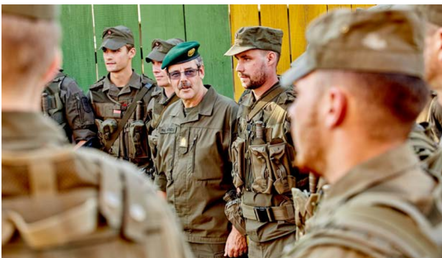
Hameseder bei der Truppe

Ein wichtiger Anreiz ist die gleiche Ausrüstung für alle Soldaten – und somit auch für die Miliz. Mit dem zugewiesenen Regelbudget des Bundesheeres ist diese Zielsetzung nur schwer umsetzbar. Es freut mich daher, dass mit dem Sonderinvestitionspaket zusätzliche finanzielle Mittel bereitgestellt werden konnten. Aus diesen Mitteln wurden und werden Investitionen für die Jägerbataillone der Miliz, für Teile Versorgungsbataillon/Miliz und für die Spezialeinsatzkräfte/Miliz getätigt. Dazu gehören ungeschützte und geschützte Mobilität, Kommunikationsmittel, Ausrüstung wie z.B. Kampfhelme, Nachtsichtbrille, modulare ballistische Schutzwesten sowie Scharfschützengewehre und die StG77 Modifikation. Für die dringend notwendige Vollausstattung und damit materiellen Einsatzbereitschaft aller Miliz-Bataillone werden weitere spezifische Budgetmittel erforderlich sein.