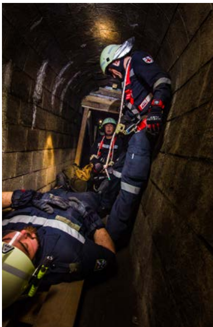
Für Klaustrophobie ist hier kein Platz.

INSARAG System. Verbindungsoffiziere aller internationalen Teams arbeiten dort zusammen und koordinieren den Hilfeinsatz.