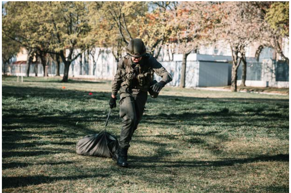
Einfach gebaut, und doch eine Herausforderung ist der 50kg schwere Personendummy