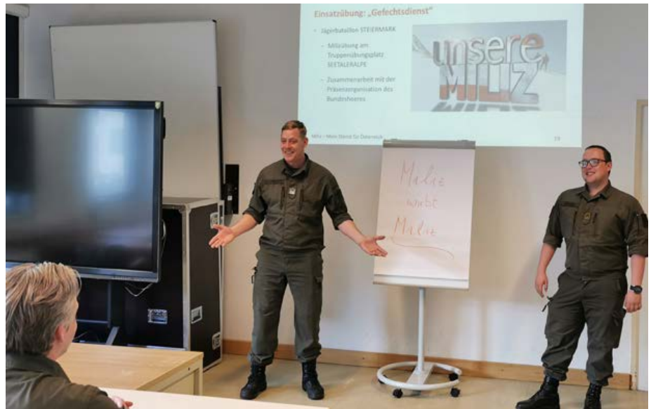
Das Tiroler Führungsteam trainiert neue Milizwerber.

Unabhängig von der Einberufungsart (Funktionsdienst oder freiwillige Milizarbeit) steht dem Werber für jeden Tag, den er oder sie für das Projekt MwM leistet, eine Anerkennungsprämie von 50,- Euro zu. Dabei muss im Falle einer fMA die Dauer des Einsatzes (inkl. Vor- und Nachbereitung) mindestens vier Stunden betragen. Die Anerkennungsprämie wurde mit November 2021 eingeführt und unterstreicht, wie wichtig das Projekt der Führung ist.